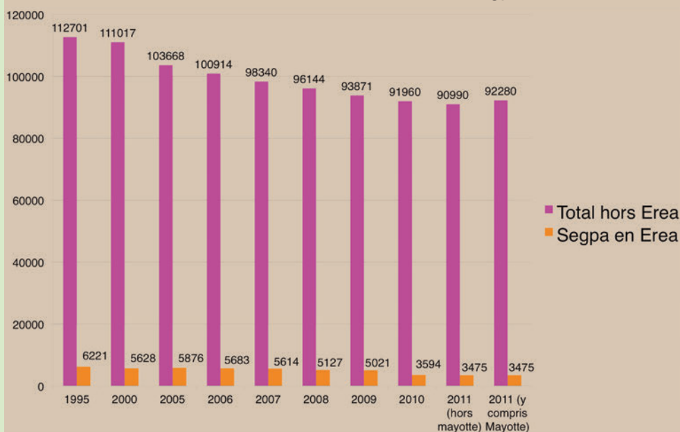
Évolution du nombre d'élèves en Segpa